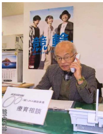
筋ジストロフィー協会 相談に対応する医師

月に1回、専門医師が主に医療に関する相談に応じる。又週1回、経験豊かな相談員が、教育、福祉、療養生活についての相談に応じる。