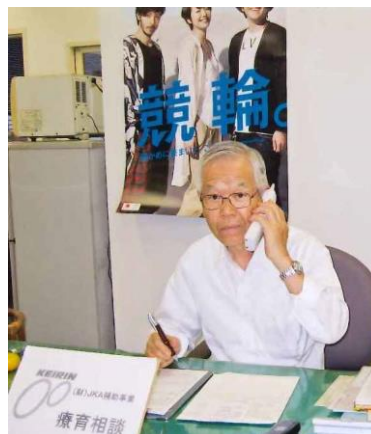
筋ジストロフィー協会 相談を受ける相談員